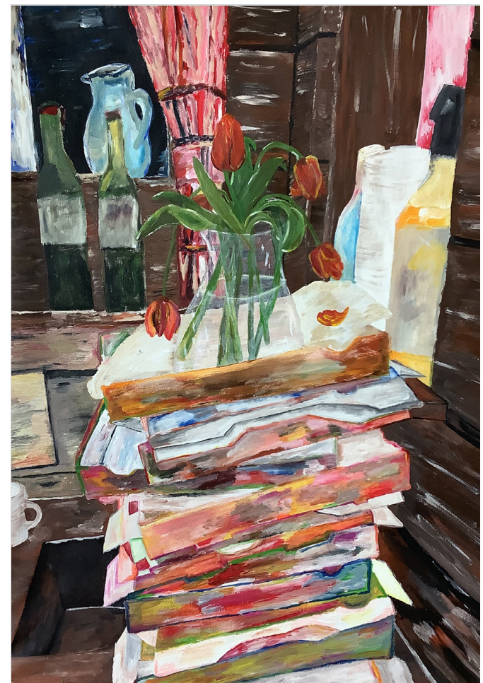
Titelseite: Stilleben, Acryl-Malerei auf Papier Kurstufe 1.1, Albertus-Magnus-Gymnasium Ettlingen